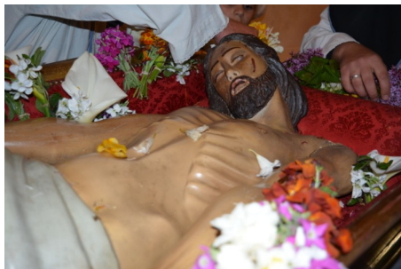
Il corpo di Cristo deposto dalla croce