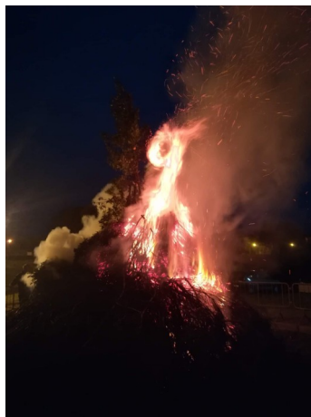
Il falò votivo in onore di San Sebastiano