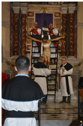
La deposizione di Gesù dalla croce- S'Isclavamentu