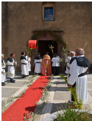
Processione della Domenica delle Palme