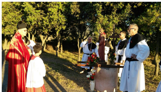
Processione in onore di Santa Vittoria