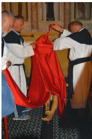
Il rito dell'innalzamento della croce- S'Inclavamentu